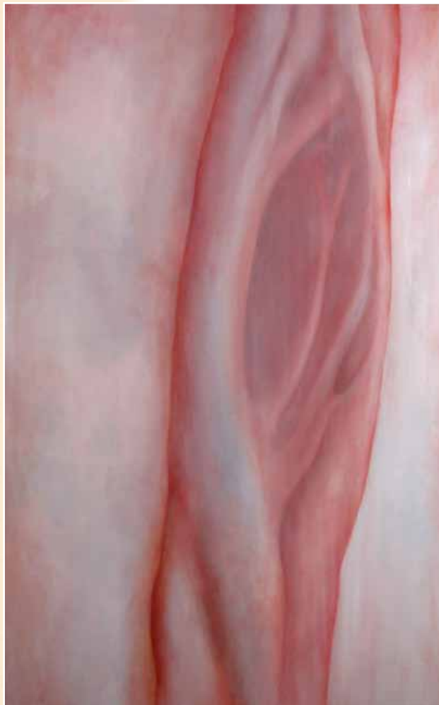
Bent Hedeby Sørensen Inanna / brænde 209 x 131 cm. 2011

Malerierne er oprindelig udført til en gruppeudstilling med titlen Nedstigning, som tog udgangspunkt i en ca 4000 år gammel sumerisk myte. Myten omhandler Inanna der er gudinde for sex i alle dens former, frugtbarhed og krigsførelse. Jeg kan sige at jeg arbejder i maleri, foto og video. Ofte tager jer udgangspunkt i kunsthistorien og myter, som jeg forsøger at revitalisere, ved at sætte de gamle fortællinger sammen med en personlig oplevelse.