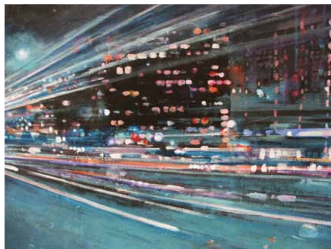
Vicky Steptoe "Det, der var i går, er i dag en drøm". En væg-installation med 2 større og 13 små malerier, som tilsammen skaber en collage af enkle visioner, der lever igennem drømmen og virkeligheden - "Lys og Mørket".